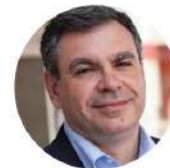
Νίκος Βέττας Γενικός Διευθυντής IOBE, Καθηγητής στο Οικονομικό Πανεπιστήμιο Αθηνών