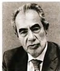
© Λεωντίνος Θαλασσινός Καθηγητής Οικονομικών στο Πανεπιστήμιο Πειραιώς

Θα υπάρξουν λοιπόν πιέσεις τόσο στο κόστος διακίνησης των προϊόντων όσο και στο κόστος ενέργειας και κεφαλαίων. Η πολυετής βιομηχανία θα ευνοηθεί ακόμα περισσότερο, όπως και οι εταιρείες ενέργειας και, φυσικά, οι ναυτιλιακές. Νέα μέτρα για τη στήριξη των αδύναμων είναι και πάλι αναγκαία.