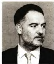
© Αθανάσιος Βασιλιάδης Πρόεδρος του Ξενοδοχειακού Επιμελητηρίου Ελλάδας

τά πόσο έχει αποπληρωστεί η παγκόσμια οικονομία, ποιο είναι το ονομαστικό διαθέσιμο εισόδημα αφαιρούμενων των υψηλών τόκων και ποια είναι η ζήτηση των βασικών αγαθών. Και όλα τα ανωτέρω σε περιβάλλον χαμηλής ανεργίας, όπου δεν υπάρχει οικονομικό ιστορικό προηγούμενο, με την καμπύλη Phillips να φαίνεται ανεπαρκής για οποιαδήποτε άσκηση πρόβλεψης και οικονομικής πολιτικής. Για την Ελλάδα, τα επόμενα έτη, αρχής γενομένης από το 2024 και με δεδομένο ότι δεν θα αντιστραφεί το θετικό momentum αξιοπιστίας και μεταρρυθμίσεων, η μείωση των επιτοκίων, σε συνδυασμό με τις επενδύσεις του Ταμείου Ανάκαμψης, αναμένεται να αποτελέσει ορόσημο, καθώς οι φθηνές αποτιμήσεις των ελληνικών assets και η αντιστροφή της αύξησης των επιτοκίων θα ωθήσουν τις νέες επενδύσεις κεφαλαίου στον ευρωπαϊκό μ.ό., ήτοι από το 14,88% του ΑΕΠ να φτάσουν στο 22,38% του ΑΕΠ της ευρωζώνης, με όλες τις θετικές επιπτώσεις στην περαιτέρω μείωση της ανεργίας, του δημοσίου χρέους και εν γένει στην ευημερία του ελληνικού λαού.