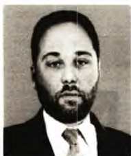
© Παναγιώτης Σχίζας Ερευνητής στο Πανεπιστήμιο της Ζυρίχης