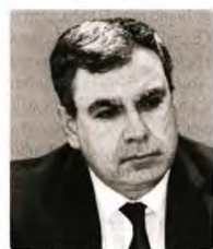
© Νίκος Βέτσας Γενικός Διευθυντής IOBE, καθηγητής Οικονομικού Πανεπιστημίου Αθηνών