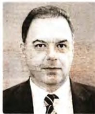
© Παναγιώτης Λιαργκόβας Πρόεδρος του ΚΕΠΕ και του Εθνικού Συμβουλίου Παραγωγικότητας, καθηγητής στο Πανεπιστήμιο Πειραιώς

εκπνέει σήμερα για το 2023 (1,8%). Το 2024 θα είναι έτος-σταθμός για τα δημόσια οικονομικά, καθώς προβλέπονται σημαντική επιστροφή σε πρωτογενές αποτέλεσμα 2,1% του ΑΕΠ, από 1,1% του ΑΕΠ το 2023, και μια σημαντική αποκλιμάκωση του χρέους ως ποσοστού του ΑΕΠ. Εξαίτιας κυρίως της ανάπτυξης αναμένεται να αποκλιμακωθεί από το 172,6% του ΑΕΠ το 2022 σε 160,3% το 2023 και σε 152,3% το 2024. Η χώρα έχει εισέλθει πλέον σε έναν ενάρετο κύκλο μείωσης του χρέους και οικονομικής ανάπτυξης. Το μεγάλο ζητούμενο είναι η μετατροπή της τρέχουσας οικονομικής ανάκαμψης σε βιώσιμους ρυθμούς ανάπτυξης. Ο μόνος τρόπος για να γίνει αυτό είναι η επιτάχυνση των μεταρρυθμίσεων.