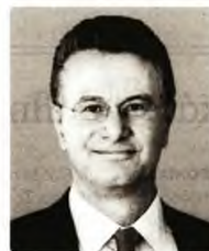
© Δημήτρης Παπααλεξόπουλος Πρόεδρος του Δ.Σ. του ΣΕΒ

Το ύψος και η έλλειψη προβλεψιμότητας των τιμών ενέργειας συνεπάγονται υπαρκτούς κινδύνους για τις ενεργοβόρες επιχειρήσεις όλων των κλάδων. Η νέα ύφεση στην Ευρώπη φρενάρει τις εξαγωγές. Η εθνική μας υστέρηση σε καινοτομία και ψηφιακό μετασχηματισμό ενέχει κινδύνους. Οι γεωπολιτικές συνθήκες δεν εμπνέουν σιγουριά.