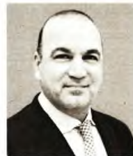
© Ιωάννης Μασούτης Πρόεδρος Κεντρικής Ένωσης Επιμελητριών

τητες και να βελτιωθεί περαιτέρω η ανταγωνιστικότητα της ελληνικής οικονομίας. Το 2024, η ανάπτυξη της οικονομίας επιστρέφει και στους εργαζομένους και στις επιχειρήσεις. Γι' αυτό το 2024 το ελληνικό επιχειρείν θα πρωτοστατήσει και πάλι στις «κατακτήσεις» της ελληνικής οικονομίας για τη διατήρηση του υψηλότερου ρυθμού ανάπτυξης. Στις επενδύσεις και στις άμεσες ξένες επενδύσεις που προσελκύουμε από το εξωτερικό. Στις εξαγωγές και στο εγχώριο εμπόριο. Στη βελτίωση των παρεχόμενων υπηρεσιών στον τουρισμό και στη βιομηχανία. Στη βιοτεχνία και σε επαγγελματικούς κλάδους που πρωτοστατούμε.