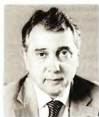
© Βασίλης Κορκίδης Πρόεδρος του Εμπορικού και Βιομηχανικού Επιμελητηρίου Πειραιώς

Σε αυτή την κατεύθυνση υποστηρικτικά λειτουργούν η αναπτυξιακή ορμή της οικονομίας, η βελτίωση της εικόνας της χώρας μας διεθνώς, η πράσινη μετάβαση, η διαθεσιμότητα χρηματοδοτικών πόρων, οι μεταρρυθμίσεις που συνεχίζονται. Περιθώρια εφρασακισμού, όμως, δεν υπάρχουν. Οι τεχνολογικές εξελίξεις καλπάζουν, οι ανταγωνιστές μας επενδύουν και αυτοί μαζί, δεν μένουν στάσιμοι. Χρειάζεται να επιταχύνουμε τη βελτίωση της ανταγωνιστικότητας. Όμως, δεν υπάρχει αμφιβολία ότι, παρά τις δυσκολίες, κινούμαστε προς τη σωστή κατεύθυνση.