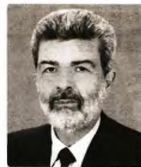
© Νανδοιάννης Μαραβέγιας Καθηγητής Πολιτικής Οικονομίας στα Εθνικά και Καποδιστριακά Πανεπιστήμια Αθηνών, πρώην υπουργός, πρώην αντιπρόεδρος ΕΚΠΑ

Ακόμη, με τη συνδρομή του Ταμείου Ανάκαμψης, αναμένεται σταδιακή κάλυψη του επενδυτικού κενού σε σχέση με τον μ.ό. της Ε.Ε., μέσω της αύξησης και της στροφής των επενδύσεων σε περισσότερο παραγωγικούς τομείς, πέραν της οικοδομής και των κατασκευών, κάτι που θα αυξήσει την παραγωγικότητα, που σήμερα δεν ξεπερνά το 55% του μ.ό. της Ε.Ε. Μόνο έτσι, βοηθούσης και της βελτίωσης της εκπαίδευσης, μπορεί να επιτευχθεί τα αμέσως επόμενα χρόνια αύξηση των αμοιβών των εργαζομένων, όπως στοχεύει η κυβέρνηση. Η αύξηση των αμοιβών θα βελτίώσει τη θέση της χώρας μας μεταξύ των χωρών της Ε.Ε., ενώ, ενδυναμώνοντας την αγοραστική δύναμη των πολιτών, θα αντισταθμίσει τον εισαγόμενο πληθωρισμό, ιδίως στην ενέργεια και στα τρόφιμα.