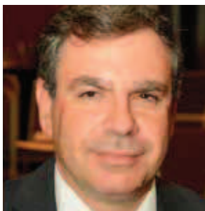
Του Νίκου Βέττα

Καθηγητή Οικονομικού Πανεπιστημίου Αθηνών και Γενικού Διευθυντή ΙΟΒΕ