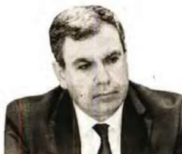
ΝΙΚΟΣ ΒΕΤΤΑΣ Καθηγητής Οικονομικού Πανεπιστημίου Αθηνών, γενικός διευθυντής ΙΟΒΕ

Υπό κανονικές συνθήκες, γνωρίζουμε ότι ανατέλλει μια θετικότερη δεκαετιαετία από την προηγούμενη, με βελτίωση της θέσης της εργασίας αλλά και των επιχειρήσεων. Για να συμβεί, όμως, αυτό χρειάζεται μια ουσιαστική μεταρρυθμιστική παρέμβαση: Παιδεία, στο πλαίσιο ενός συνδυασμού παροχής γνώσεων και δεξιοτήτων. Επίπεδο διαβίωσης και κοινωνική συνοχή ευάλωτων ομάδων του πληθυσμού, στο πλαίσιο ενός προγράμματος γενναίας αναμόρφωσης των επιδομάτων ανεργίας και των προνοιακών επιδομάτων. Τέλος, απαιτούνται νέες διαδικασίες απονομής δικαιοσύνης και ρυθμιστικής αποτελεσματικότητας στο πλαίσιο αναμόρφωσης και του τρόπου απονομής της δικαιοσύνης, αλλά και του τρόπου με τον οποίο οργανώνεται η διαμόρφωση των κανόνων δικαίου.