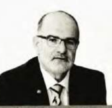
ΓΙΩΡΓΟΣ ΚΑΒΒΑΘΑΣ Πρόεδρος της Γενικής Συννομοσπονδίας Επαγγελματιών, Βιοτεχνών και Εμπόρων Ελλάδος