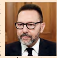
Δεν πρέπει να αντιστρέψουμε τα ουσιαστικά μέτρα που εξασφάλισαν δημοσιονομική ισορροπία, τονίζει ο διοικητής της Τ.Ε. Γιάννης Στουρνάρας.

«Αν λάβουμε υπόψη μας ότι δύο φορές κατά το παρελθόν, το 2012 και κυρίως το 2015, η συντριπτική πλειονότητα των αναλυτών και ακαδημαϊκών οικονομολόγων πίστευε ότι η Ελλάδα δεν θα τα κατάφερε να παραμείνει στο ευρώ, είναι μεγάλη επιτυχία το γεγονός ότι σήμερα επιστρέφει στην κανονικότητα», σχολιάζει ο διοικητής της Τράπεζας της Ελλάδος Γιάννης Στουρνάρας, μιλώντας στην «Κ». Εκκινώντας ο ίδιος χθες από πρώτο χέρι την εμπειρία των δύσκολων μνημονιακών χρόνων, ως υπουργός Οικονομικών και κεντρικός τραπεζίτης, ο κ. Στουρνάρας ερσιότα, ωστόσο, την προσοχή: «Πρέπει να προσέξουμε», λέει, «να μην επαναλάβουμε τα λάθη του παρελθόντος που μας οδήγησαν στα μνημόνια. Δεν πρέπει να αντιμετωπίσουμε τα ουσιαστικά μέτρα των μνημονίων, π.χ. στο ασφαλιστικό, στη φορολογία και τη δημοσιονομική διαχείριση, που εξασφάλισαν δημοσιονομική ισορροπία».