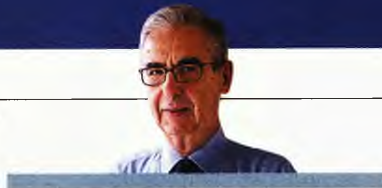
ΤΟΥ ΓΙΩΡΓΟΥ ΠΡΕΒΕΛΑΚΗ

Επομένως, τονίζει η μελέτη του ΙΟΒΕ, η ελληνική εκπαίδευση αντιμετωπίζει διπλή πρόκληση. Από τη μια, να συγκλίνει τη λειτουργία της με τις άλλες χώρες, βελτιώνοντας και τη ποιότητά της και, από την άλλη, να αντιμετωπίσει το επερχόμενο σοκ της συρρίκνωσης του εκπαιδευτικού συστήματος τα προσεχή χρόνια.