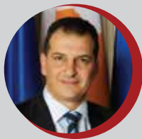
Γιώργος Λακκοτρίπης Υπουργός Ενέργειας, Εμπορίου, Βιομηχανίας και Τουρισμού Κυπριακή Δημοκρατία