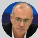
Δημήτρης Μάρδας Υφυπουργός Εξωτερικών