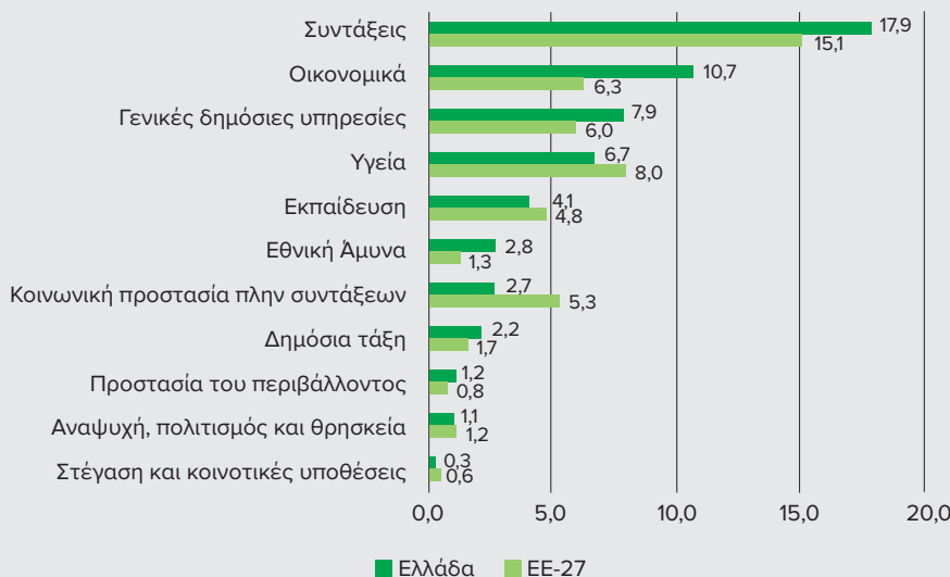
Διάγραμμα 2. Δαπάνη γενικής κυβέρνησης ανά κατηγορία το 2021 (ως % του ΑΕΠ)