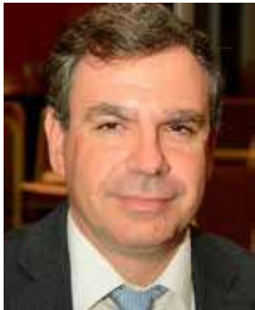
Του Νίκου Βέττα

Καθηγητή Οικονομικού Πανεπιστημίου Αθηνών και Γενικού Διευθυντή ΙΟΒΕ