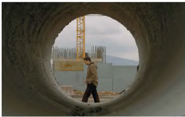
Στο εργοτάξιο , κάπου στην Αθήνα την περίοδο της οικονομικής κρίσης, ο χρόνος μοιάζει να έχει «παγώσει». Δεκαετίες νωρίτερα, στα πρώτα βήματα της Μεταπολίτευσης η Ελλάδα, βιώνοντας τη θετική επίδραση της παγκόσμιας οικονομίας, αναπτύχθηκε κυρίως με αύξηση της ιδιωτικής και δημόσιας κατανάλωσης, της κατεύθυνσης των αποταμιεύσεων στα ακίνητα και λιγότερο με επενδύσεις που οδηγούσαν σε εξαγωγές.